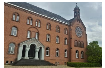
klooster St. Jozef