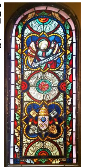
gebrandschilderd raam Hemelvaart van St. Jozef