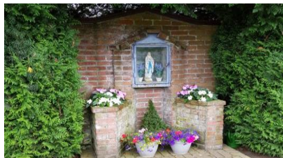
Het kapelletje vóór de opknopbeurt