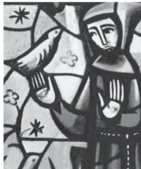
Afbeelding: glas in lood raam uit de Verzoeningskerk van Taizé. Voorstellende Sint Franciscus die het evangelie predikte tot de vogelen des hemels.