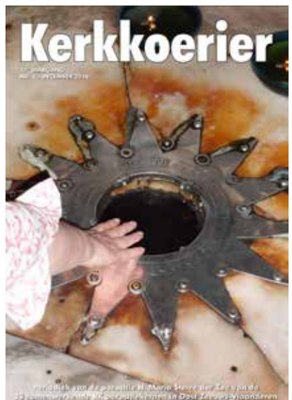
De eerste (september 2002) en de laatste (december 2018) Kerkkoerier