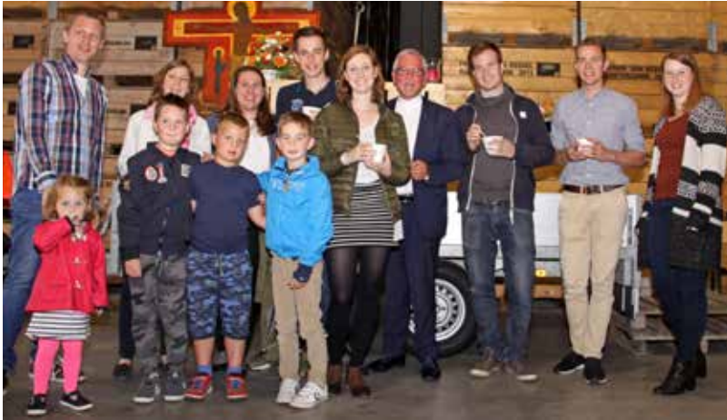
2017 – Kloosterzande

In onze parochie houden we ieder jaar een parochiedag op de 1ste juli zondag. Hierbij worden alle parochianen uitgenodigd aanwezig te zijn. De eerste parochiedag werd gehouden in 2017 in Kloosterzande op het fruitbedrijf bij de familie Van Kessel.