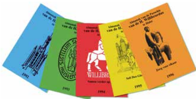
Collage van almanakken van de voormalige H. Willibrordusparochie