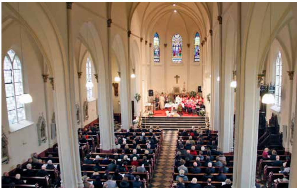
Viering 150 – jarig bestaan parochiekerk Stoppeldijk – 2010