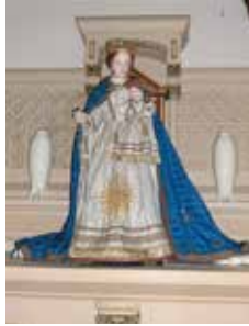
Clinge: kruisweg en staakmadonna (foto staakmadonna WM)