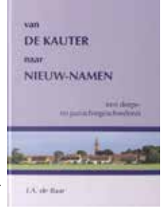
Nieuw-Namen: geschiedenis van de Kauter

Elk jaar wordt, op de laatste zondag van juni, de 'staakmadonna' (Mariabeeld vooraan in de kerk) meegedragen in de Maria Ommegang van Bergen op Zoom. En zo viert men in Nieuw-Namen elk jaar op de tweede zondag van september het feest van hun patroonheilige, de H. Nicolaas van Tollentino. Op die dag worden de gewijde Nikolaasbroodjes uitgedeeld aan de parochianen ter genezing van de zieken.