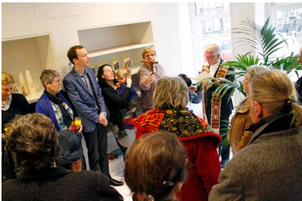
Er is veel belangstelling voor ons nieuwe onderkomen!