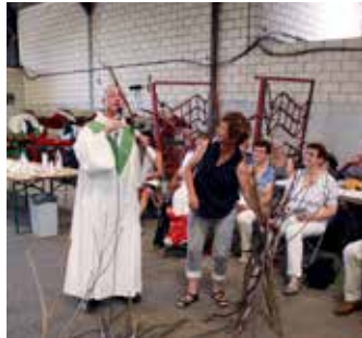
2018 – Koewacht