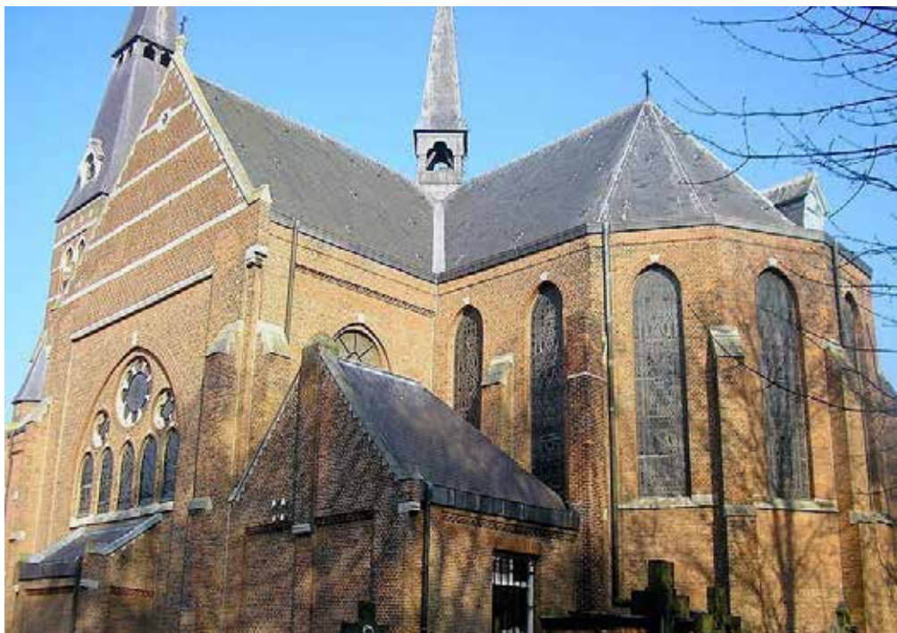
Kerk van de H. Catharina te Hengstdijk