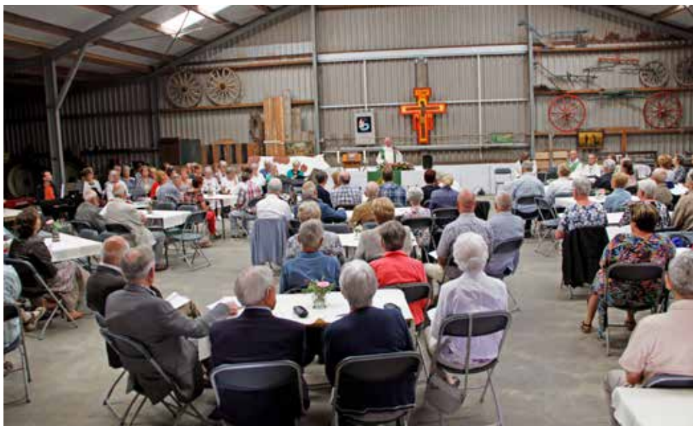
2019 – Sint Jansteen