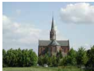
H.Cornelius - Lamswaarde, H.Gerardus Majella - Terhole, H.Martinus – Kloosterzande (foto's JK)

Kerkzijn is allereerst een gebeuren van mensen. Mensen die de vieringen bezoeken, een kaarsje komen opsteken. Dat kerkzijn kan alleen blijven bestaan dankzij vrijwilligers, die hun tijd en enthousiasme hiervoor beschikbaar stellen. Koorleden, koster, onderhoudsploeg, vrijwilligers, die actief zijn in werkgroepen, houden het kerkzijn in stand. Helaas worden ook wij geconfronteerd met het feit dat er minder mensen zijn, die hiervoor de handen uit de mouwen willen steken. Dat vraagt dan om creativiteit. Dat heeft er toe geleid dat de