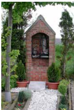
Mariakapellen in Ossensisse en Lamswaarde en in Kloosterzande