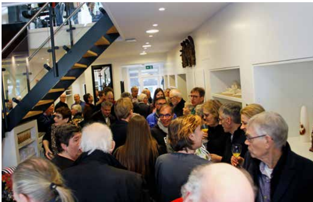
Drukte tijdens de receptie op 29 februari 2020